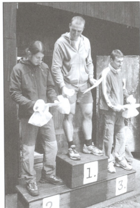
Tři nejlepší v lidovém běhu