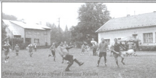
Do tabulky střelců se zápsal i starosta Vaculín