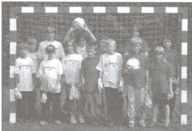
Smišená družstva začek a žáků z Horního konce