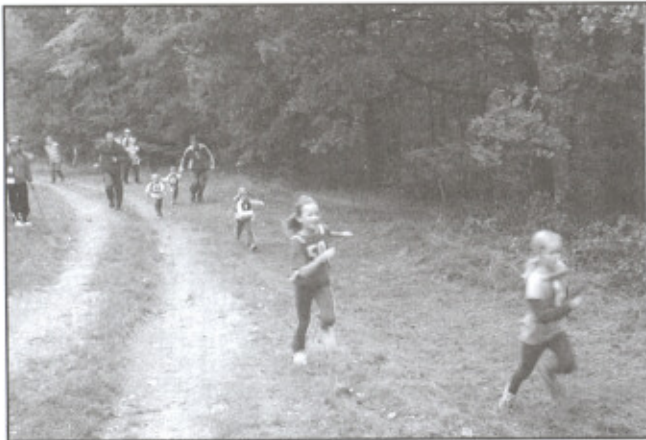
Při závodě si zaběhali i tatínčí