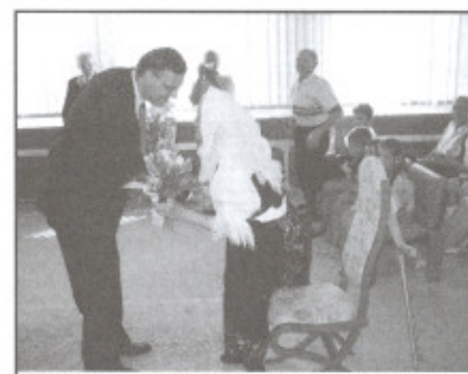
K blahopřání se připojil také ministr Petr Nečas.

"Předstupuji před vás s velkou úctou, pokorou a obdivem, dožít se sta let v takové