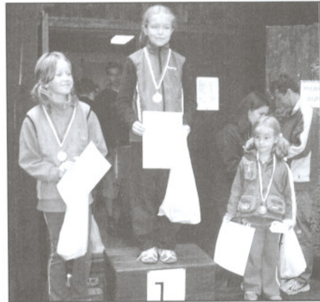
Tři nejlepší v kategorii předžáčky