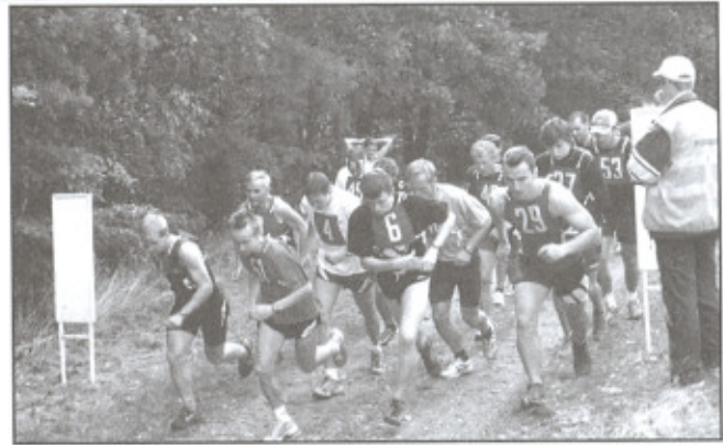
Start nejpočetnější skupiny - muži