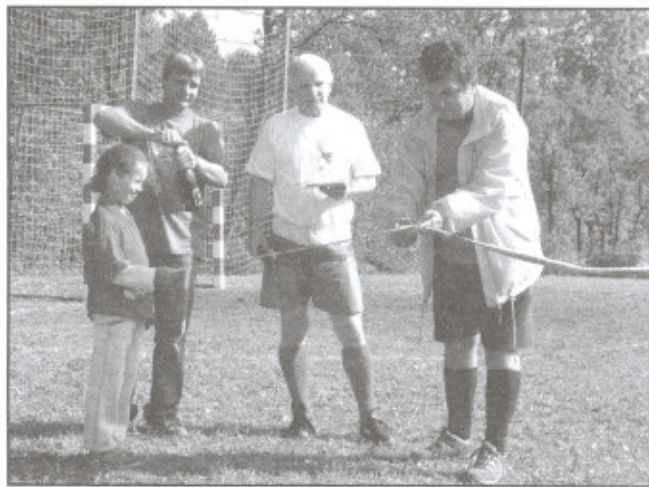
Slavnostní přestřižení pásky.