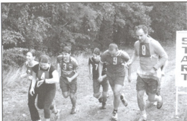
Start lidového běhu