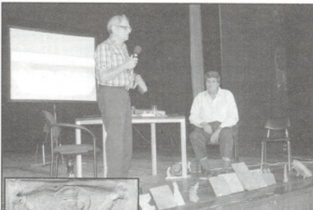
Jedna z nejvýznamnějších kachlí z depožitáře Muzea Zubří