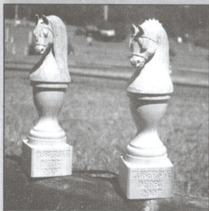
Netradiční trofeje pro vítěze vozatajských soutěží

14. července uspořádal Jezdecký klub Zubří na Přelačíně již XI. ročník tradičních jezdeckých závodů.