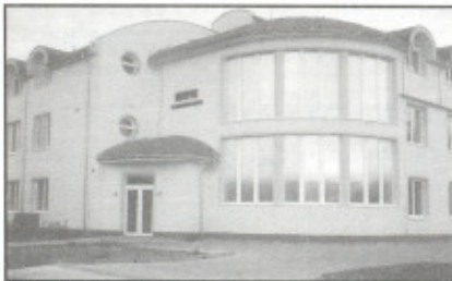
Nový hospic v Palárikově