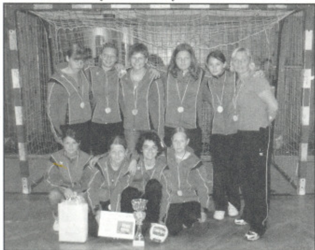
První den sehrály čtyři utkání. Do turnaje vstoupily vítězným nad ZŠ Olomouc 19:12.

Ve dnech 29. a 30.5.2008 se uskutečnilo v Ostravě Celostátní finále přeboru České republiky základních škol v házené žaček - "NOVINÁŘSKÝ KALAMÁŘ 2008", kterého se účastnily i házenkářky ze ZŠ Zubří.