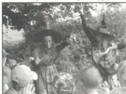
Děti potkaly čarodějnice...