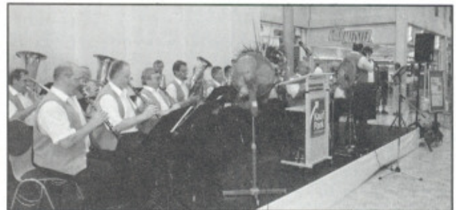
Zubřanka zahájení výstavy v Kauf Parku Göttingen.