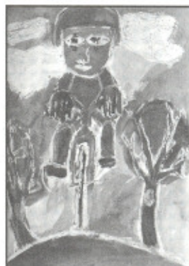
Sport - Mojmir Kocurek

U dalších soutěží jsme doposud neobdrželi výsledky.