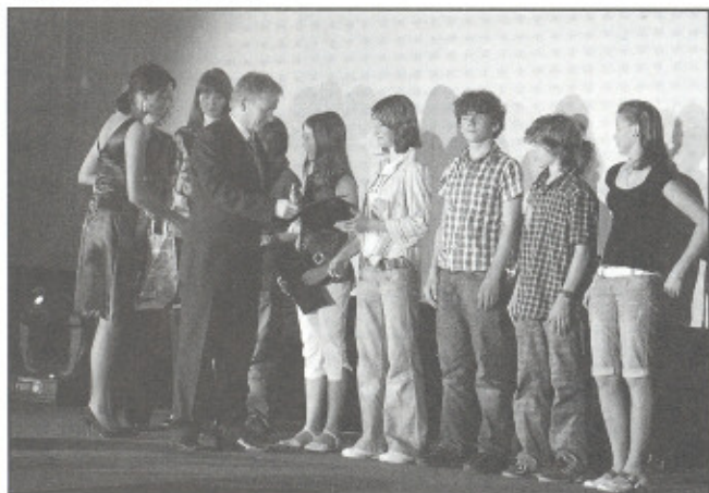
ocenění mladí lyžaři