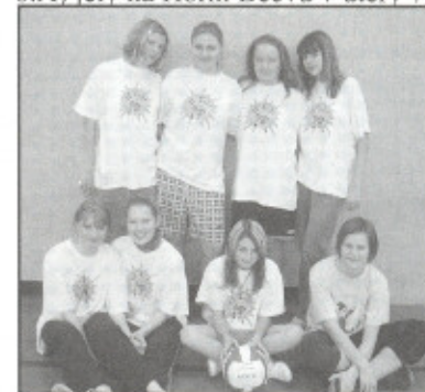
Volejbalové družstvo děvčat 8