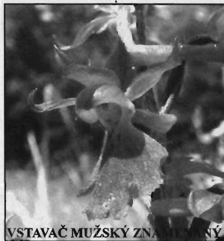
VSTAVAČ MUŽSKÝ ZNAMENANÝ

Například několik sterilních i kvetoucích exemplářů vstavače bledého / Orchis pallens / vyrůstá v dubnu a květnu na spásané louce v místní části Čertoryje. Tuto silně ohroženou