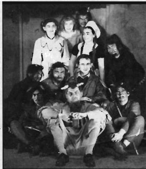
Fotografie z divadelního představení Hrátky s čertem