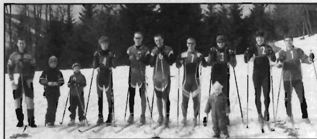
Loučení se sezonou na Pustevnách