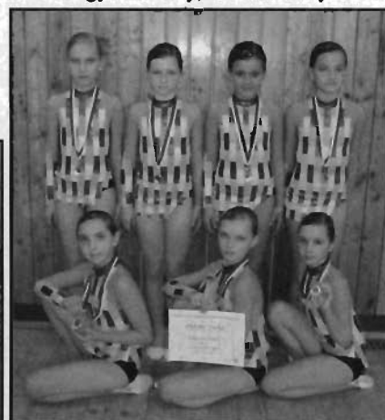
kategorie 10 - 12 let