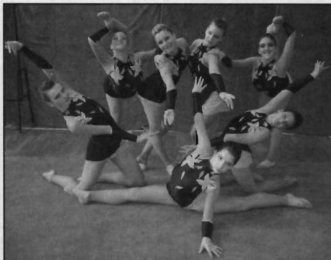
Oddíl moderní gymnastiky, TJ Gumárny Zubří

Touto cestou bychom chtěli poděkovat za poskytnutí finanční podpory pro české reprezentantky na náklady spojené s uvedeným Mistrovstvím světa, a to Městu Zubří a ZPV Rožnov, s.r.o.