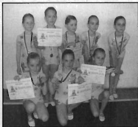
kategorie 8 let a mladší

oddíl moderní gymnastiky, TJ Gumárny Zubří