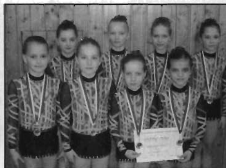
kategorie 8 - 10 let