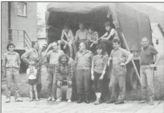
před odjezdem na Polní den (u Klubu)