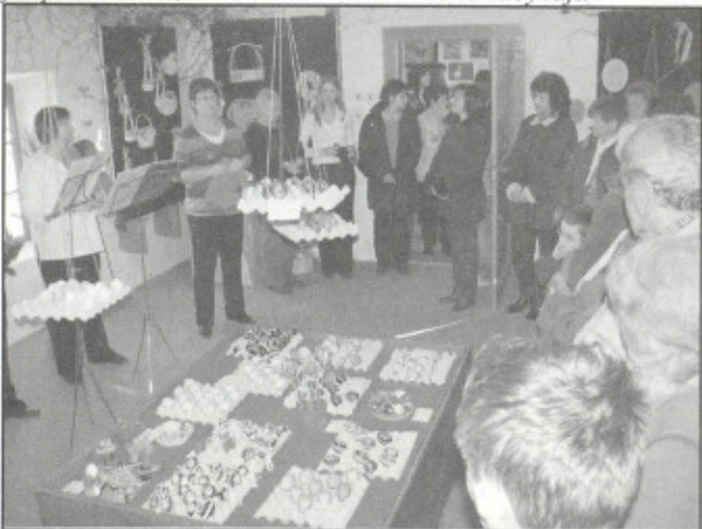
Z jarní výstavy kraslic a aranžovaných květin v Muzeu města Zubří na Petrohradě.