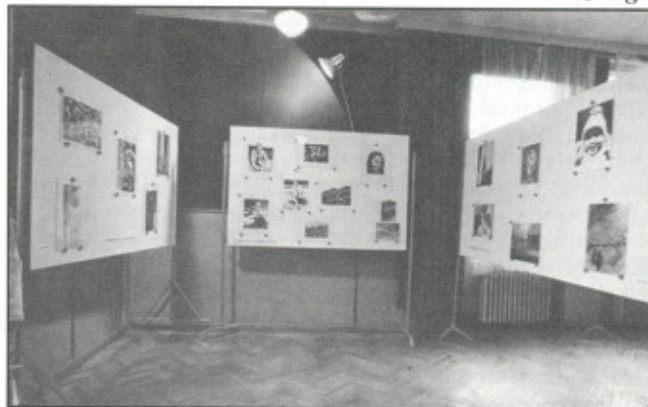
ukázka z další výstavy

Za kolektiv bývalého fotokroužku: Pavel Czišnege