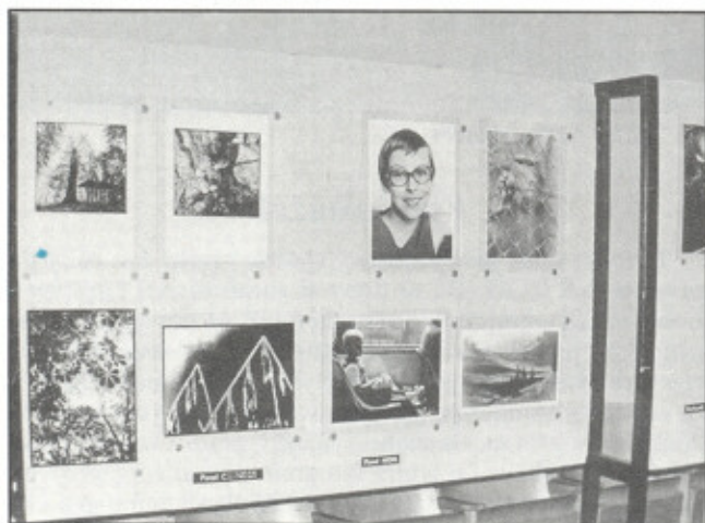
ukázka výstavy v malém sále