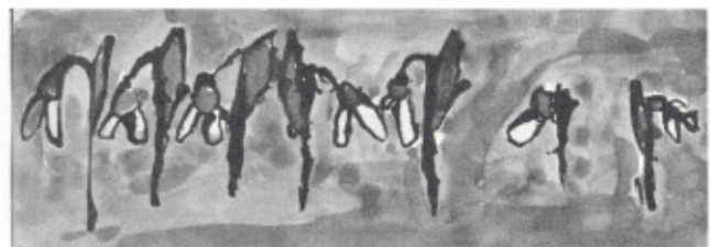
Nakreslil Jiřík Zeman z MŠ Duha