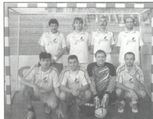
Nadace team Zubří