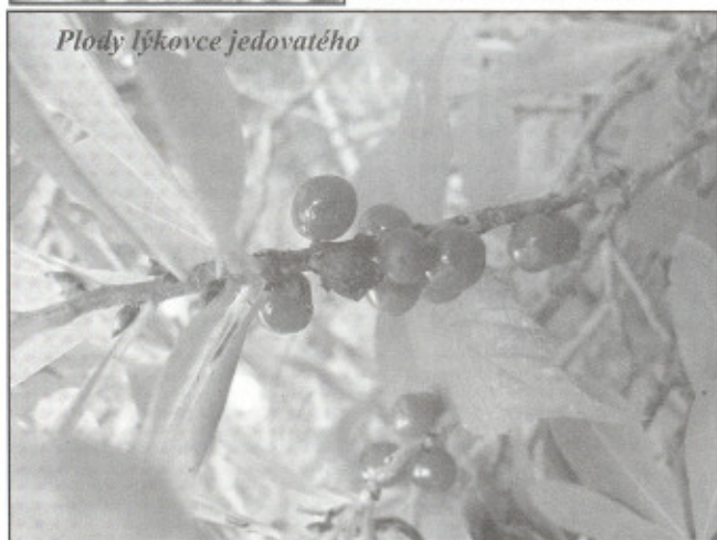
Plody lýkovce jedovatého

Lýkovec jedovatý vyhledává stín či polostín listnatých a smíšených lesů. V Zubří jej můžeme vidět např. v místní části Dlouhá.