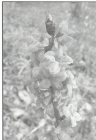
Květy lýkovce jedovatého

Lidové názvy „vlčí pepř“ nebo „divoký pepř“ získal lýkovec pro své dřívější použití k dosažení ostřejší chuti octa a hořčice.