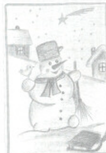
Tereza Štůsková, 14 let